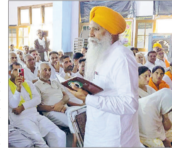
भिवानी। एकत्रित लोगों को संबोधित करते हुए।

भारतीय किसान यूनियन के नेता गुरनाम सिंह चंदूनी ने कपास पर लगाए गए 11 प्रतिशत आयात शुल्क वापिस लिए जाने से कपास किसानों को नुकसान होगा। उन्होंने कहा कि यदि यह शुल्क अगले 10 दिनों में वापिस पहले की तरह नहीं किए गए तो राज्य स्तर पर हर जिला में भारतीय किसान यूनियन प्रदर्शन करने पर मजबूर होंगे। उन्होंने कहा कि कपास पर आयात शुल्क 11 प्रतिशत लगने से कपास के भाव न्यूनतम समर्थन मूल्य से काफी नीचे आ गए हैं। इससे कपास का किसान बर्बाद हो