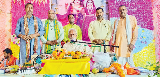
भिवानी। श्री मद्भागवत कथा के दौरान प्रवचन करते हुए।

शिव गंगा कहलाई और उसकी केवल एक धारा को पृथ्वी पर भेज दिया गया। कथा प्रसंग के अतिरिक्त