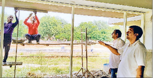
भिवानी। जिमखाना क्लब में काम करते कारीगर।