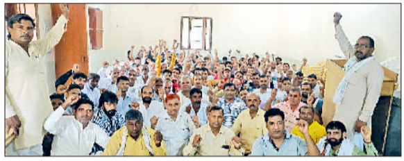
भिवानी। मांगों को लेकर प्रदर्शन करते कर्मचारी।

उन्होंने कहा कि वे अपनी ड्यूटी ईमानदारी और निष्ठा से करते हैं, और उन्हें अपनी उपस्थिति साबित करने के लिए किसी भी तकनीकी प्रणाली की आवश्यकता नहीं है। उन्होंने कहा कि सरकार को उन पर विश्वास करना चाहिए और उनकी समस्याओं को समझना चाहिए। साथ ही कर्मचारियों ने तैलवली भी दी कि यदि सरकार उनकी मांगों पर ध्यान नहीं देती है, तो वे अविश्वस के दौरान अहिंसक आंदोलन करने के लिए मजबूर होंगे। प्रदर्शन व उपवास के दौरान अधिकारी, स्वास्थ्य कर्मचारी और चिकित्सकों ने अपनी एकता का परिचय दिया। सभी ने एक साथ बिलकर अपनी मांगों को रखा।