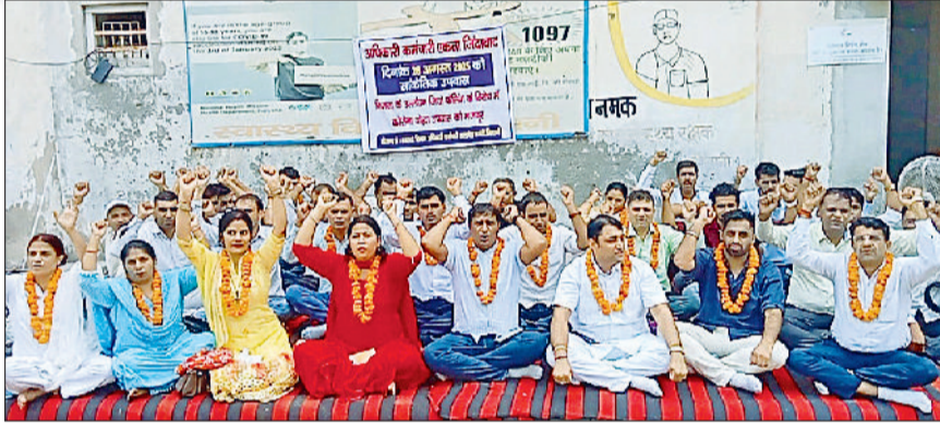
भिवानी। जियो फेंसिंग के विरोध में धरने पर बैठे कर्मचारी।

स्वास्थ्य विभाग के कर्मचारियों ने वीरवार को भिवानी के सिविल सर्जन कार्यालय के सामने जियो-फेंसिंग आधारित उपस्थिति दर्ज करने के आदेश के विरोध में उपवास रखा। यह विरोध प्रदर्शन स्वास्थ्य विभाग अधिकारी कर्मचारी तालमेल कमेटी हरियाणा के आह्वान पर किया गया, जिसमें स्वास्थ्य विभाग के सभी संगठनों ने बढ़-चढ़कर भाग लिया। उपवास के दौरान, कर्मचारियों ने एक गेट मीटिंग का आयोजन किया, जिसमें उन्होंने जोरदार नारेबाजी और रोप प्रदर्शन किया। इस अवसर पर विभिन्न कर्मचारी संघों के नेताओं ने जियो-फेंसिंग प्रणाली के नकारात्मक प्रभावों पर विस्तार से बात की। उन्होंने कहा कि यह प्रणाली कर्मचारियों पर अनावश्यक दबाव डालेगी और उनके मनोबल को गिराएगी। गेट मीटिंग के बाद