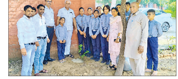
भवानीखड़ा। स्कूल में पौधेरूपित करते हुए।